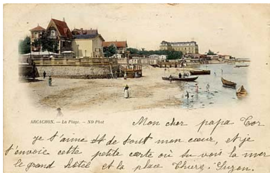
Type 4 : type 2 numérotée