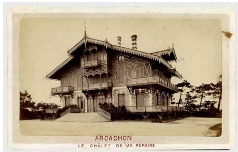
Carte de visite