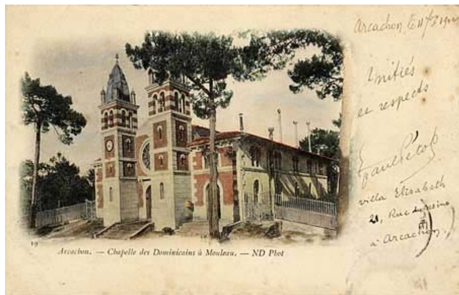
Type 6 : grand nuage numéroté noir et blanc signé Collections ND Phot