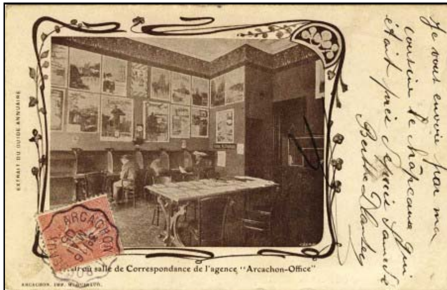
Hall ou salle de correspondance de l'agence Arcachon-Office

Nous terminerons par un exemple de ces cartes accompagné de l'illustration correspondante du Guide-Annuaire :