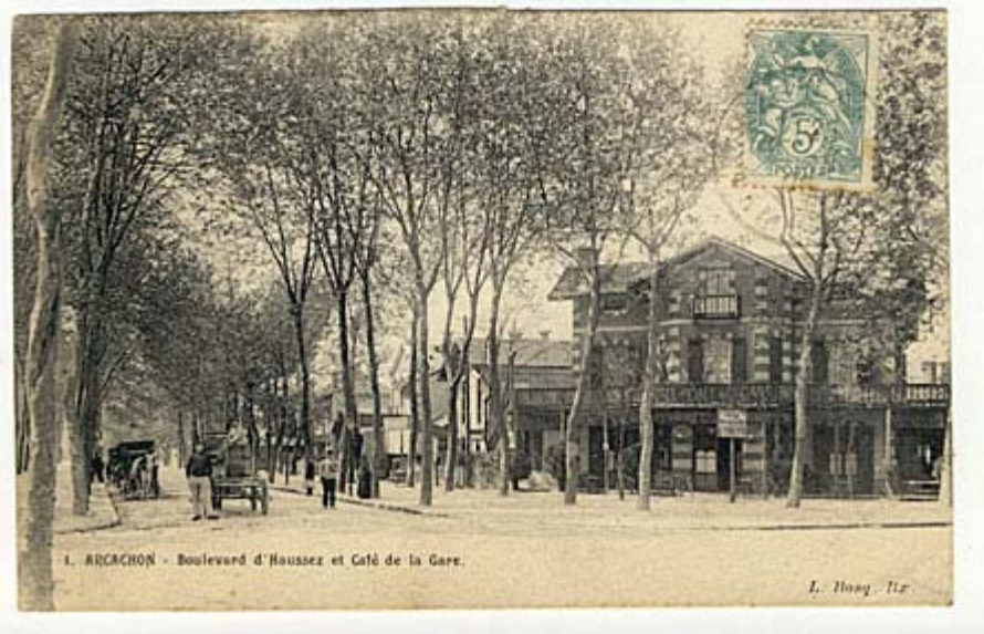
De haut en bas, deux cartes "Poittevin" non signées et une carte signée Bosq