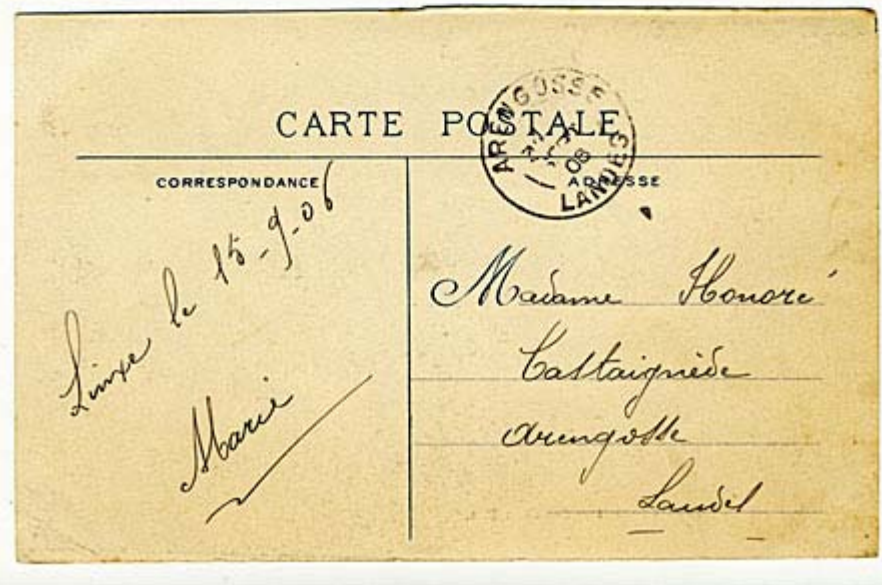
Le dos de ces trois cartes