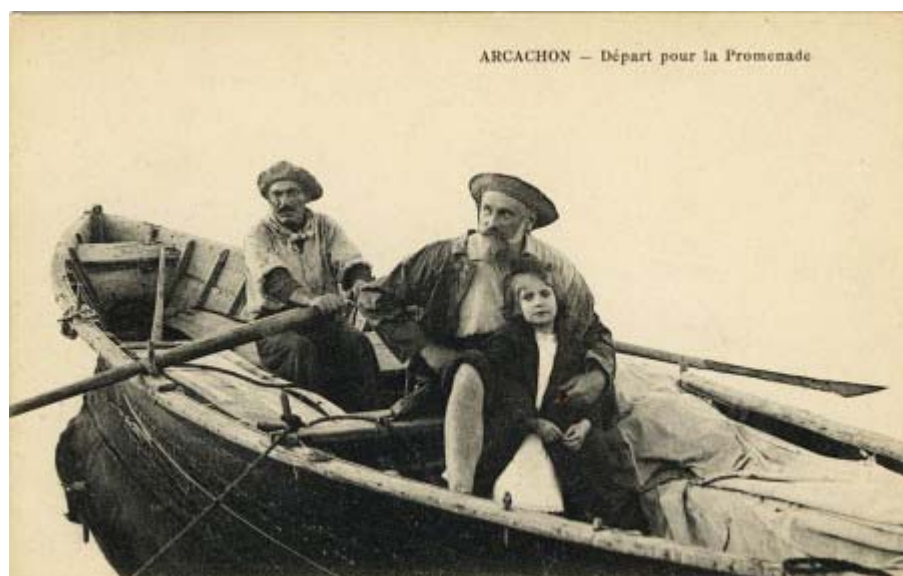
Départ pour la promenade – 1ère version – non signée

Voici deux exemples de la production initiale de Bosq, des cartes soignées, reprises plus tard dans une qualité amoindrie