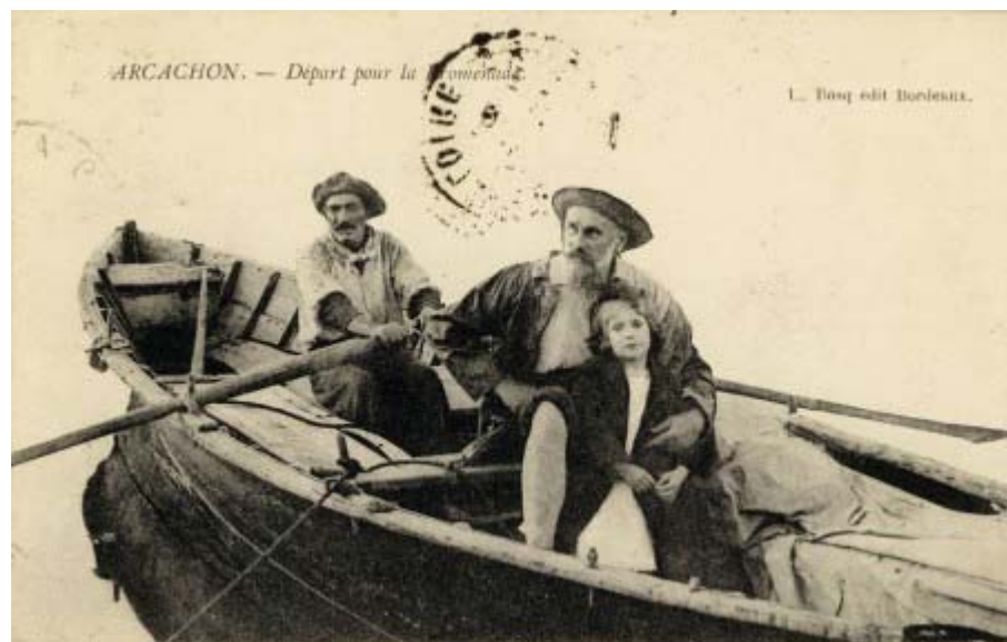
Départ pour la promenade – 2è version – Signée