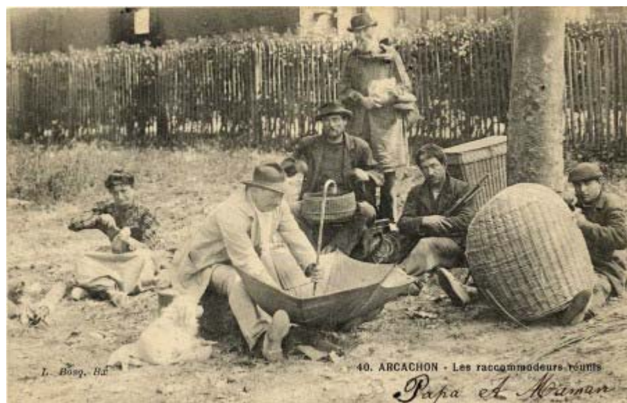
Les raccommodeurs réunis

Il est l'auteur d'une des cartes les plus rares d'Arcachon, montrant des chemineaux réparant, assis par terre aux portes de la ville, des parapluies, de la vaisselle, des paniers, et légendée avec quelque mépris « Les raccommodeurs réunis »