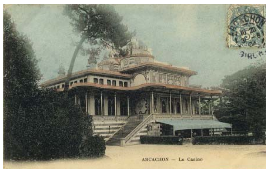
Le Casino – 1ère version – Non signée