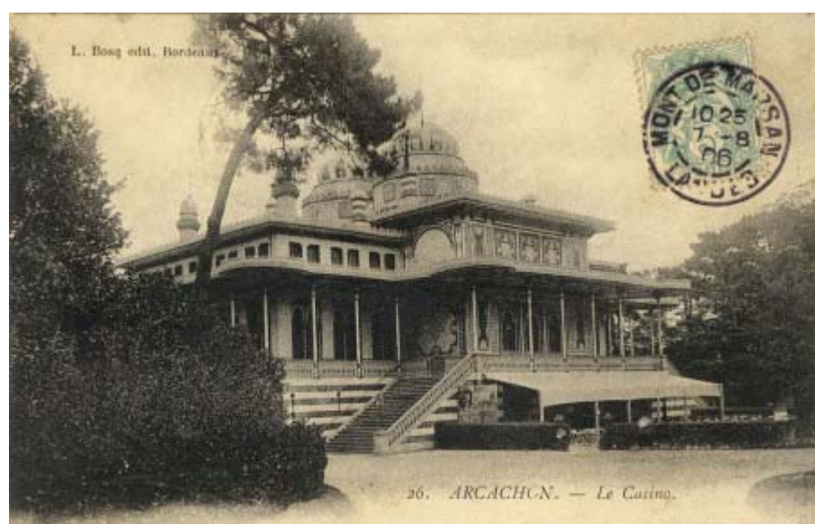
Le Casino – 2è version – Signée