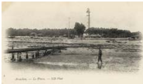
Le Phare