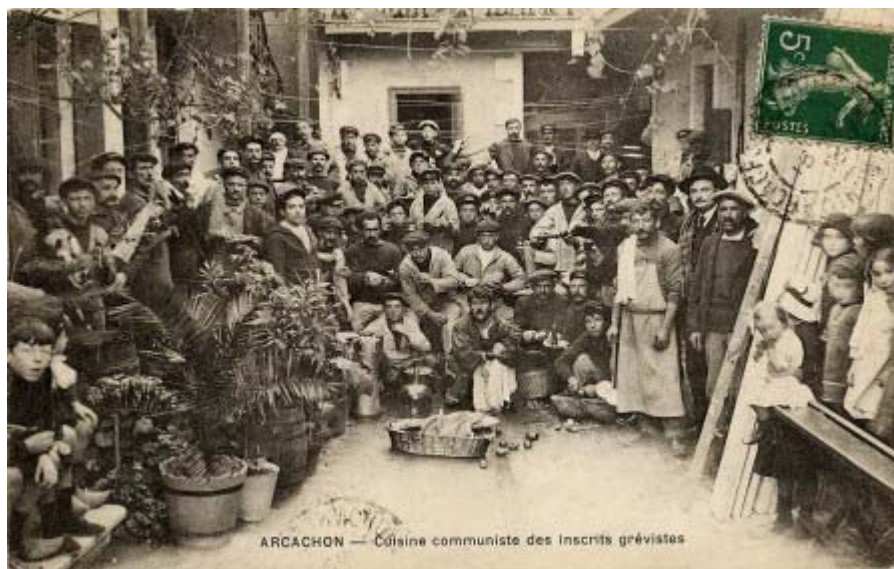
ARCACHON — Cuisine communiste des Inscrits grévistes

Chambon devait avoir une « fibre sociale » prononcée pour avoir publié de spectaculaires photos d'ostréiculteurs, suggérant toute la dureté de ce métier, et d'étonnantes photos d'une grève d'inscrits maritimes.