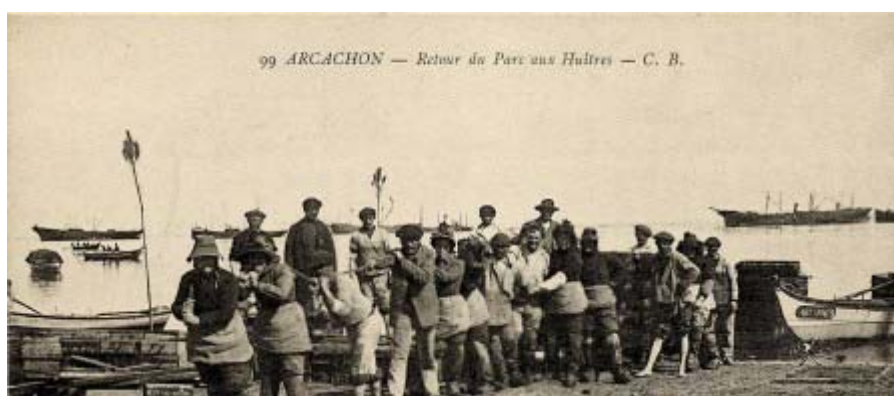
99 ARCACHON — Retour de Parc aux Huîtres — C. B.